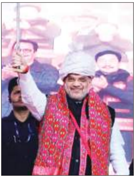
केंद्रीय गृह मंत्री अमित शाह अरुणाचल प्रदेश की सीमा से सटे गांवों में एक कार्यक्रम में हिस्सा लेते हुए।